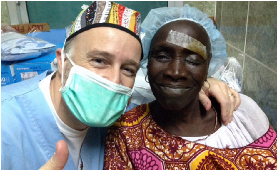
Con la Fundación Barraquer en Senegal