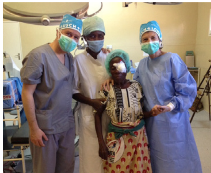
Con la Fundación Barraquer en Malawi

actualidad para combatir la desigualdad y aumentar la cohesión social.